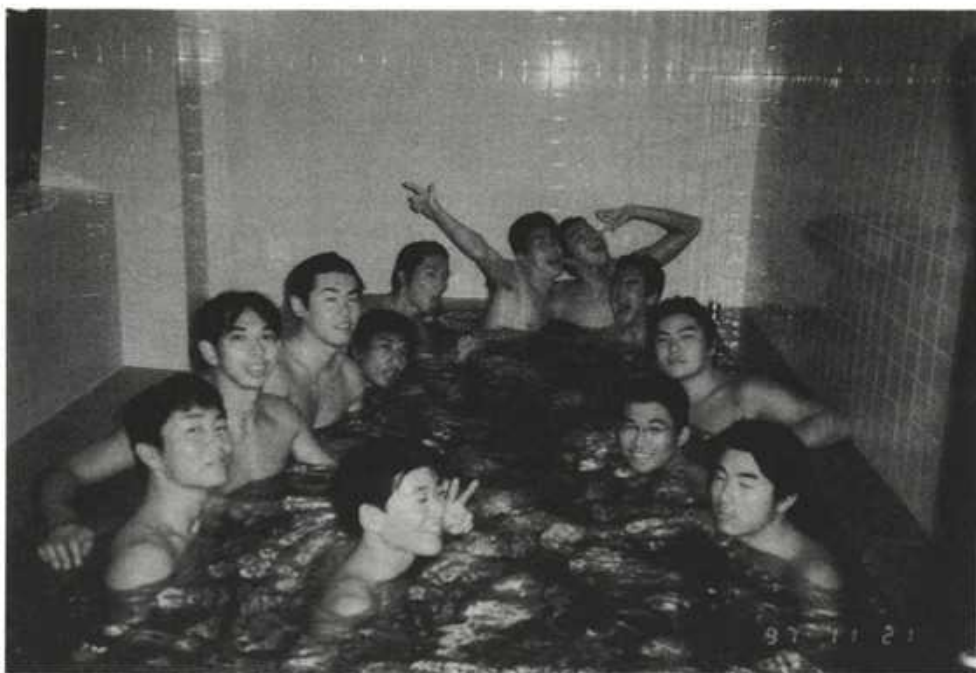
平成9年度 インカレ出場記念写真