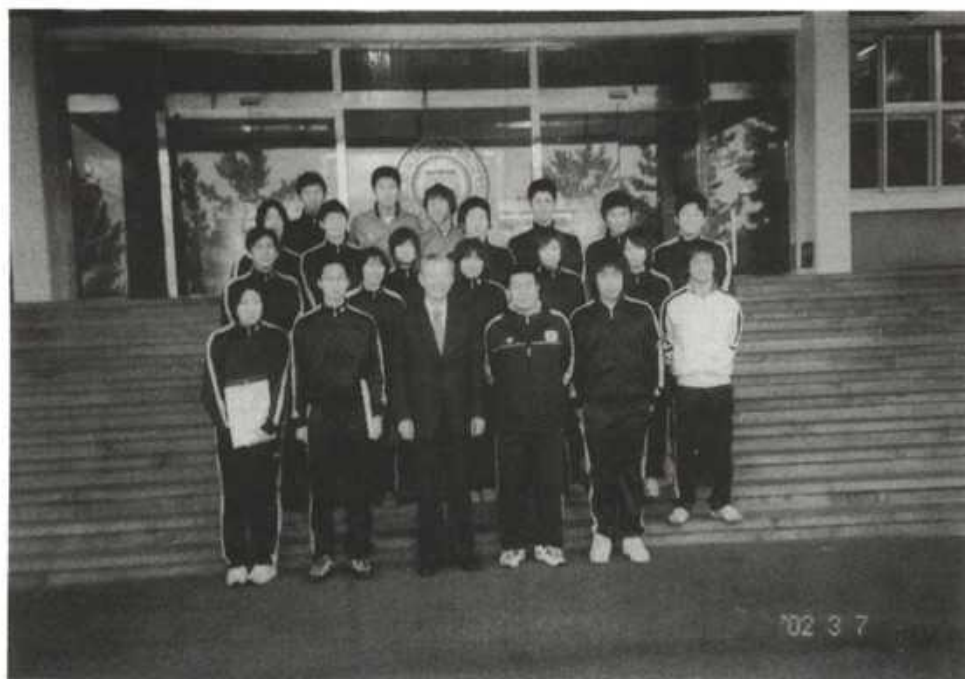
Cheju National Universityにて学長とともに記念撮影