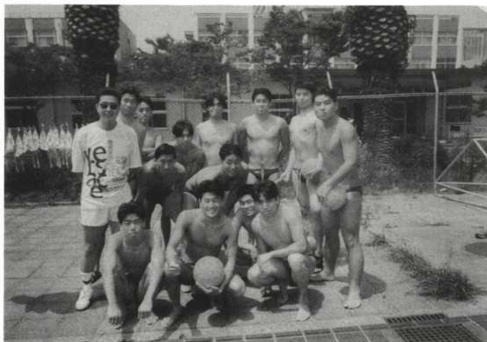
平成8年度 シーズン終了時記念写真 大阪市立大学にて