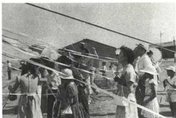
岸壁からテープを引いて別れを惜しまれる静枝夫人