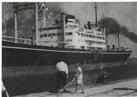
神戸港岸壁を離れるアトラス丸